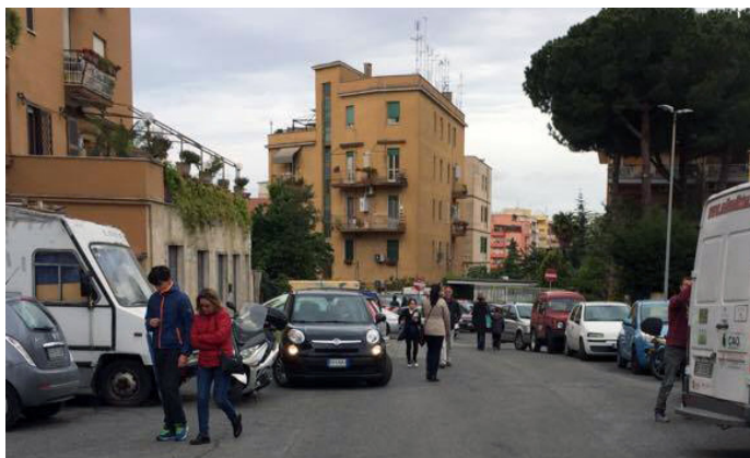
Mobilità' pedonale in una strada interna di Pineta Sacchetti

degli attori locali. La biblioteca, il centro anziani e la scuole elementare e media locali hanno facilitato le nostre interviste, i laboratori e l'esercizio di fotografia partecipata. Infatti, molte di queste istituzioni ci hanno supportato ben oltre la richiesta che abbiamo rivolto loro.