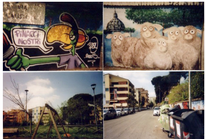
Photovoice study images of over a dozen murals that celebrate the neighborhood