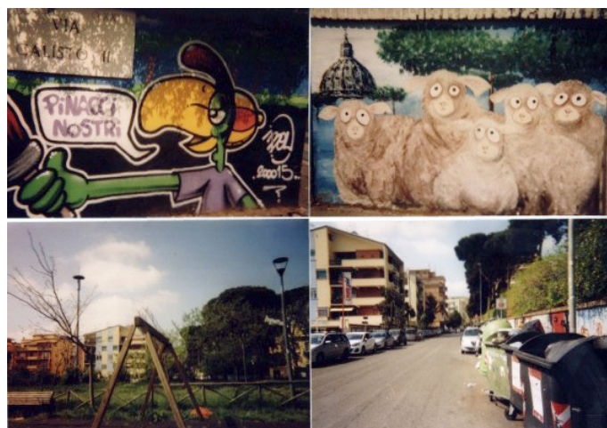
Murales rappresentato in una foto scattata nell'esercizio di fotografia partecipata